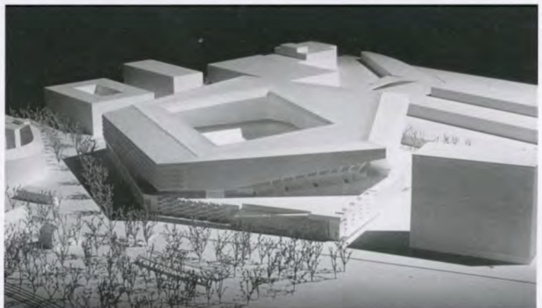
Brückenraum des Mursteg Murau, 1995; Albtalstudie für Ettlingen, Skizze 1991; Hardturm-Stadion Zürich, Modell 2009. Bilder oben und unten: Heinrich Helfenstein, gta Archiv / ETH Zürich, Archiv Heinrich Helfenstein; Bild Mitte: Meili, Peter Architekten