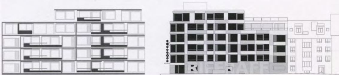
Wohnhaus RiffRaff, Zürich 2002, Zusammenarbeit mit Staufer Hasler Architekten. Innenansicht und Fassade Luisenstrasse