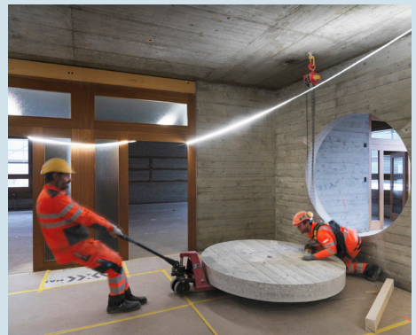
Gesamtsanierung Primarschule Kleinhüningen, ARGE BRH Architekten AG weberbuess Architekten AG Basel, 2022 – 2027