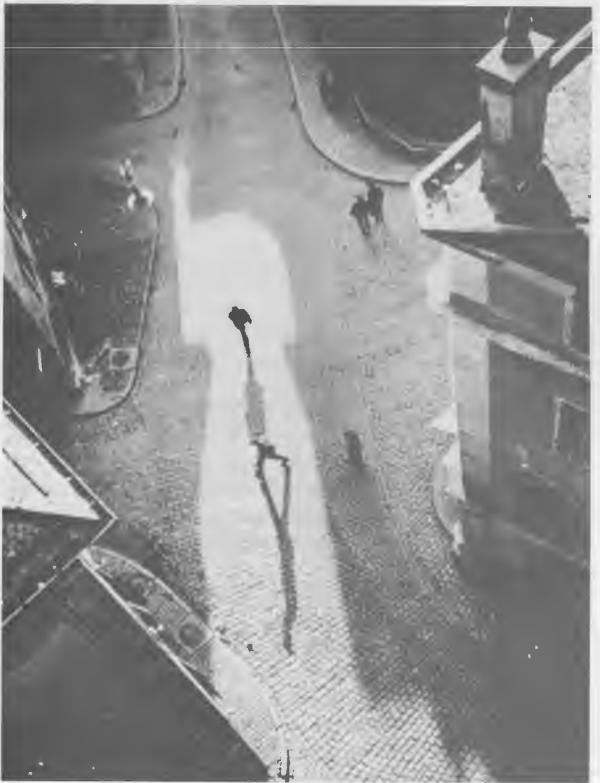
Herbert Bayer, Wannsee-Bad, 1929 und Morgen in Paris, 1925