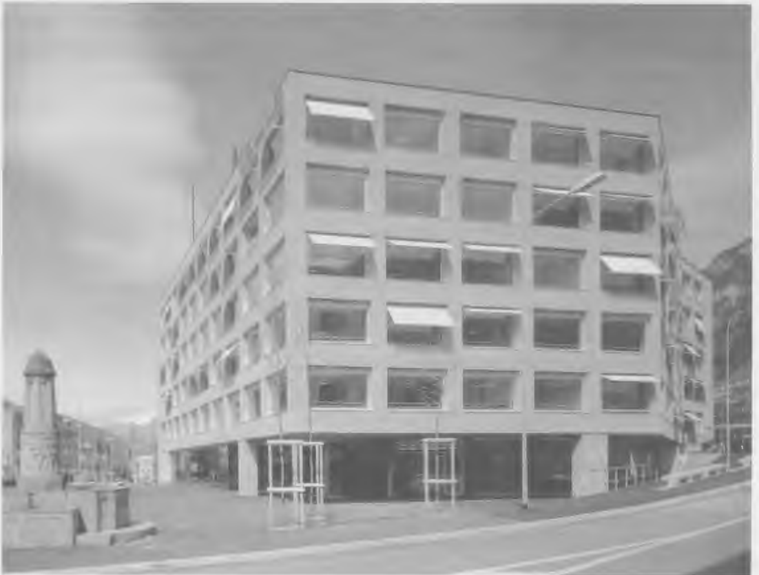
Stauer & Hasler Architekten, Neue Kantonschule Wil, Innenhof, 2004 Städtisches Verwaltungsgebäude und Medienzentrum SRG, Chur, 2005