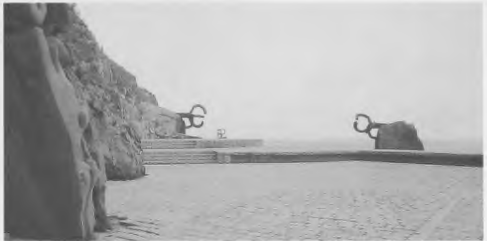
Eduardo Chillida, Peine del viento – Windkämme, 1977

Ich zeige ein Sinnbild: Die Skulptur „Peine del viento – Windkämme“ von Eduardo Chillida. Hier handelt es sich nicht um einen architektonischen Innenraum und auch nicht um Wände, sondern um skulpturale Formen im Dienste des Aufbaus eines räumlichen Spannungsfeldes.