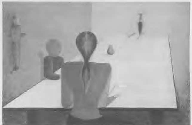
Rudolf Schwarz, St. Christoforus in Köln-Niehl, 1959 Oskar Schlemmer, Tischgesellschaft, 1923