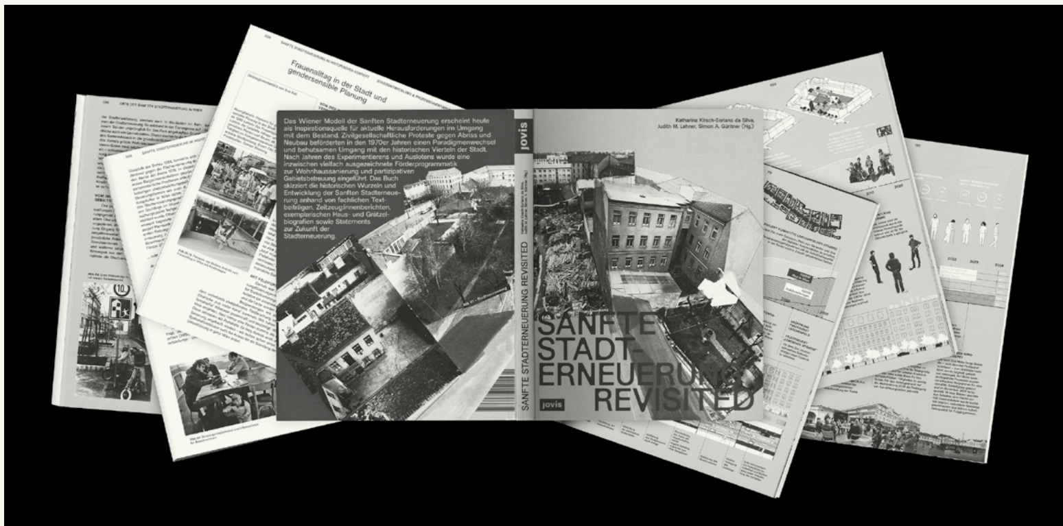
Factettenreich sind im neuen Buch zur Wiener Stadterneuerung die Strategien beschrieben, als es galt, Widerstand gegen unzimperliche Abrisse zu organisieren und die einst verfallene Metropole zu sanieren.